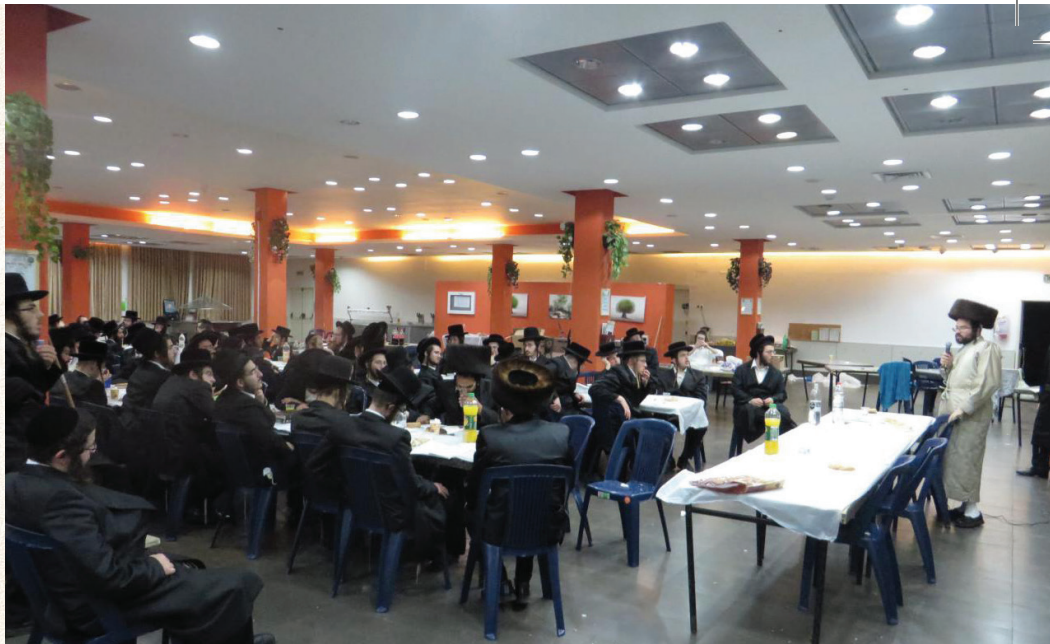
לדלות ולהשקות. ר' איתמר בשבת של חבורת 'אור הצדיק'

"התקופה בה עודדוני חבריי להגיע לאומן הייתה בערב ר"ה של שנת תש"ס, ככל שהעמיקה ההתקרבות שלי כך הלכו וגברו המניעות, אחד מקרובי שראה את התהליך ניסה להניא אותי, הוא אמר לי: אתה לא יודע שאין ברסלב'ר נורמלי? כל אחד מהם משתגע לבסוף... הורים ישבו שבעה על ילדיהם וקרעו קריעה על בנם שהתקרב לחסידות ברסלב, מה אתה עושה? הוא ממש נזף בי בשות: אתה תהרוס את החיים שלך בצעד הזה - - -