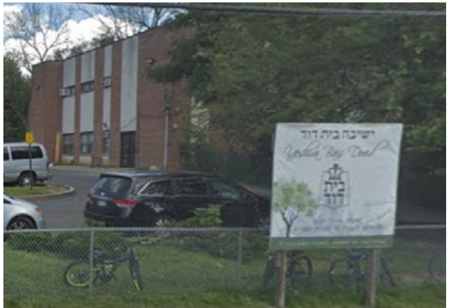
מסירות ונאמנות - בית דוד

ניגש אליו אחד מהמתפללים והחל צועק עליו לעיני כל המתפללים בצעקות רמות, כשפיו מלא טענות: מדוע זה כך ולמה זה כך. "אבא שמע את זעקותי" מספרים הבנים, "ומכיוון שהכיר את אותו אדם וידע שהוא סובל מהתמודדות לא פשוטות בחייו הפרטיים, הבין שאין מה להסביר לו וכל שעליו פשוט להקשיב לו. הוא לא הגיב על שום מילה שהוטחה כלפיו ואחרי שסיים הלה את דבריו חזר ללימודו כאילו מאומה לא אירע ושוב לא שמענו אותו מדבר על כך מעולם".