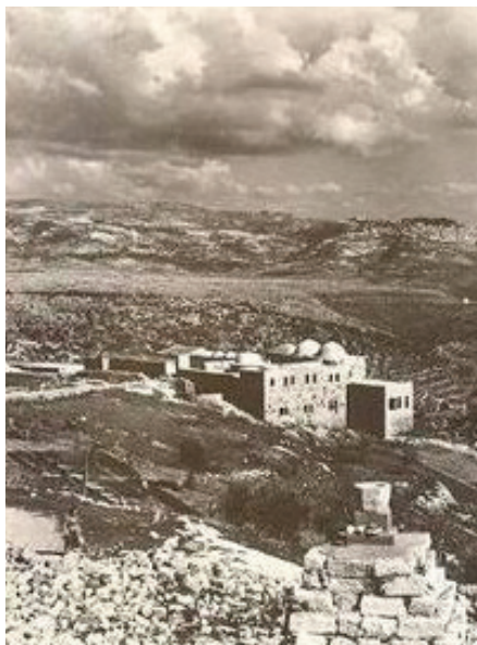
לבלות ימים שלמים. קבר רשב"י במירון בימים עברו