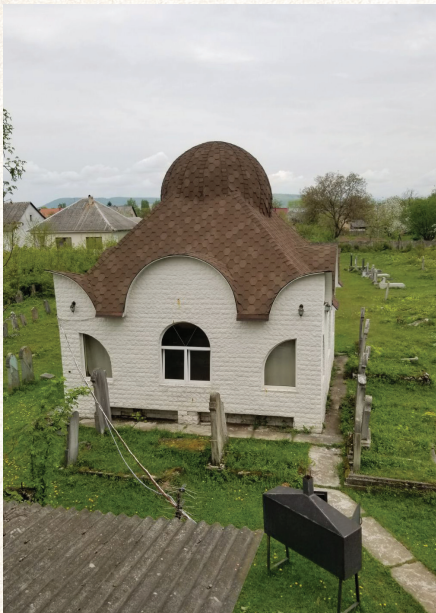
משיח ה' ר' נחמן מברסלב אוהל אדמו"רי נדבורנא בעיר בישטינא