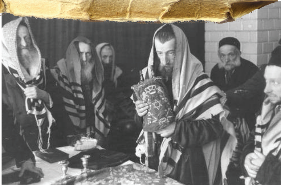
פילה תחת אש. מנין בגטו במלחמה

כן, לילוק נשרף אלילו, הוא מילל, הוא מתייפח