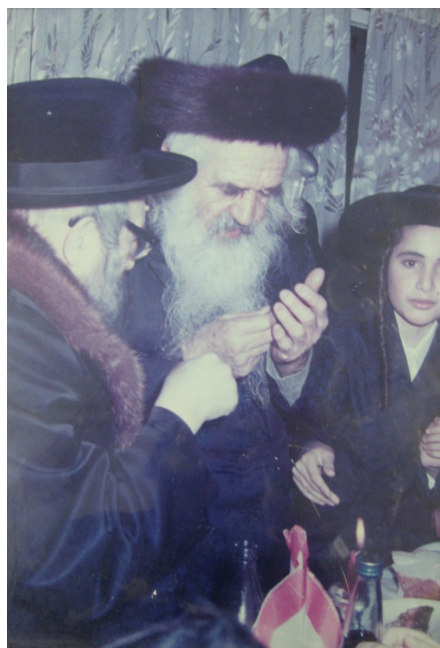
אש של יראת שמים. ר' מנדל בסוד שיח