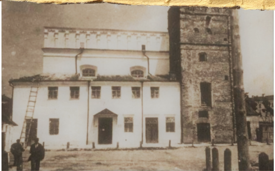
בית הכנסת בלוצק

אחרת הם החינוך והאמונה של היהודי החרדי. הוא מאמין באמונה שלמה שהשבת היא בבת עינוי של העם העברי. לחנך את בניו לפי חוקי התורה, בבחינת "למען אשר יצווה את בניו ואת ביתו אחריו ושמרו דרך ד' לעשות צדקה