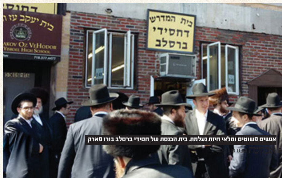
אנשים פשוטים ומלאי חיות נעלמת. בית הכנסת של חסידי ברסלב בורו פארק

זכורני כי כאשר הכנסתי את הספר הקדוש ליקוטי תפילות לארון הספרים שבביתי התמלא