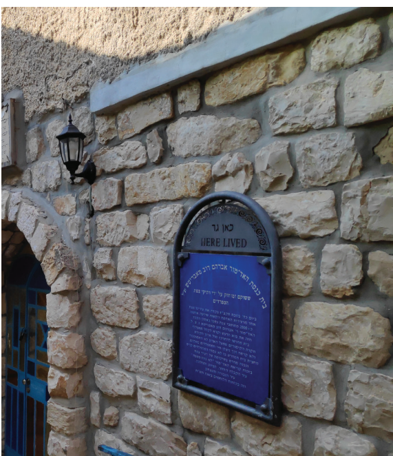
בוסה של עבודת ה'. מבנה בית הכנסת של הבית עיין בצפת שם שכנה הישיבה

בין כתלי הישיבה הנובהרדוקאית שבמזריטש, לצד מאות התלמידים שגדשו את היכל