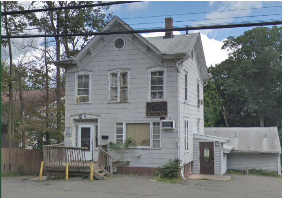
בית מדרש על שם הצדיק. ברכת הנחל כיום

בתקופה הראשונה היה מוסר את נפשו בקיץ הלוהט ובקור המקפיא של מונסי לגייס מניין לתפילות, ודאג בהארט הפנים המיוחדת שהייתה אומנותו, לתת לכל מי שרק הגיע לבית הכנסת הרגשה טובה ונעימה