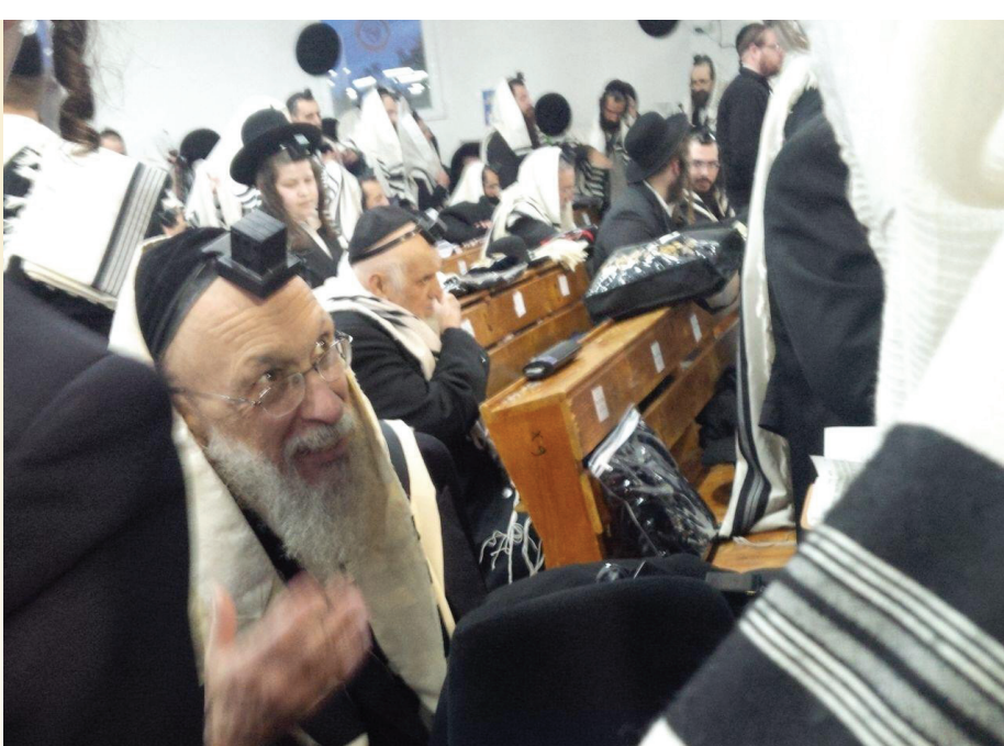
אשרינו שזכינו. באומן בראש השנה

ההלוואה השיב לו ר' יודל: "היום אין ל'בית דוד' אוטובוסים משל עצמם ואנו נאלצים להשתמש בשירותיה של חברת הסעות שבבעלות גויים. קשה לי לחשוב על כך שהמפגש הראשון של הילדים הטהורים בצאתם מביתם בבוקר יהיה עם גוי מגושם שיגיד להם 'בוקר טוב' באנגלית, במקום לקבל חיוך עם מילה טובה מפיו של נהג יהודי חסידי". כה עמוקה הייתה הרגשתו לתת את הדבר הזה לילדי תשב"ר.