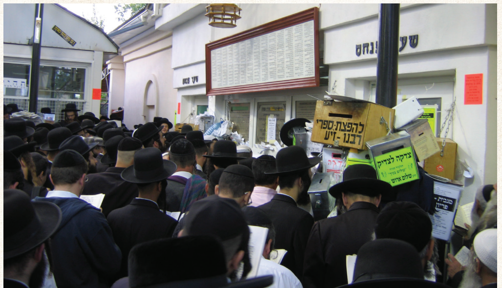
נסיעה במסירות נפש. ציון רבינו בערב ראש השנה

החלטתי לא לנסוע - - - להצניע את ההתקרבות לרבינו ולהופכה למשהו פנימי אישי. מובן כי לצורך כך היה עלי להתנתק מחבריי הברסלבער'ס, היתה לי ערימה של ספרי ברסלב, ארזתי את כולם והנחתי אותם מאחורי הדלת של אחד מחבריי, אפילו לא דפקתי בדלת, לא היה נעים... היחיד שהייתי חייב לו הסברים היה חברי