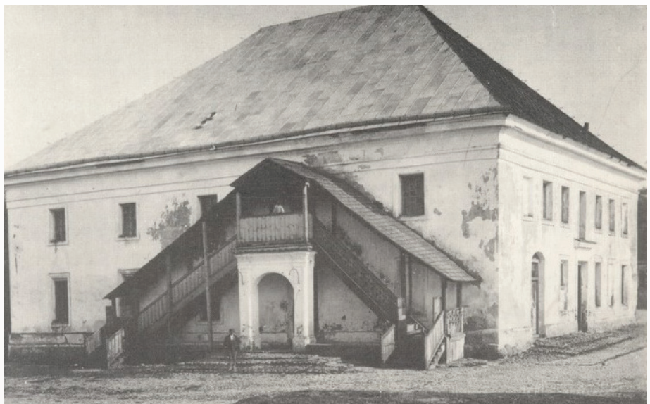
בית הכנסת בעיירה סימיאטיץ